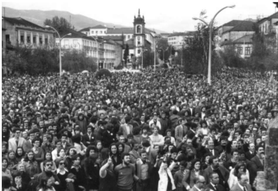
Manifestação do 1.º de Maio de 1974, Vila Real.