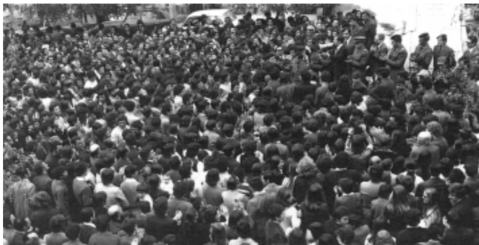
Manifestação de apoio ao Movimento Militar de 25 de Abril de 1974, Vila Real, 26 de Abril de 1974.

(Não foi elaborado qualquer texto sobre este tema)